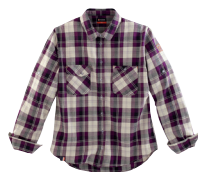
■ 1783 PURPLE