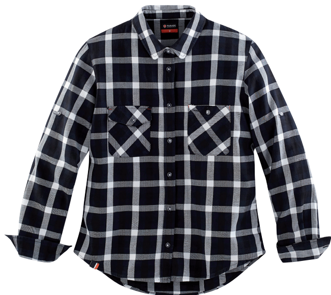
■ 1792 PARADE BLUE