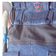
Ceinture stretch réhaussée