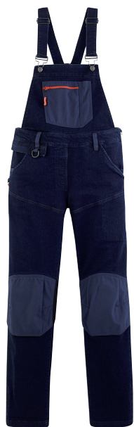
■ 1772 DENIM