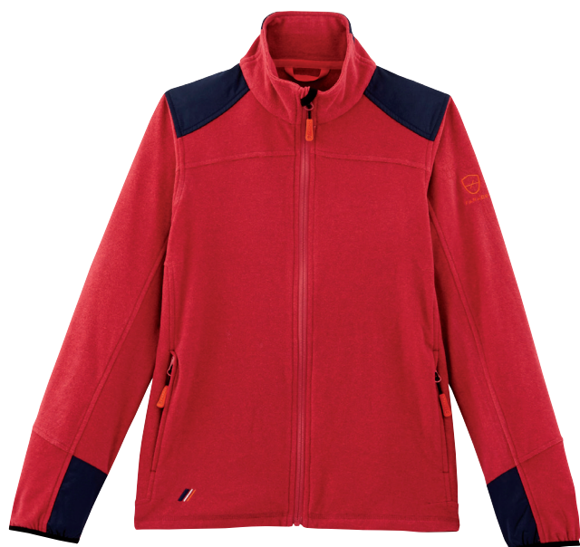
■ 1765 FRAMBOISE