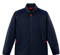
■ 1792 PARADE BLUE