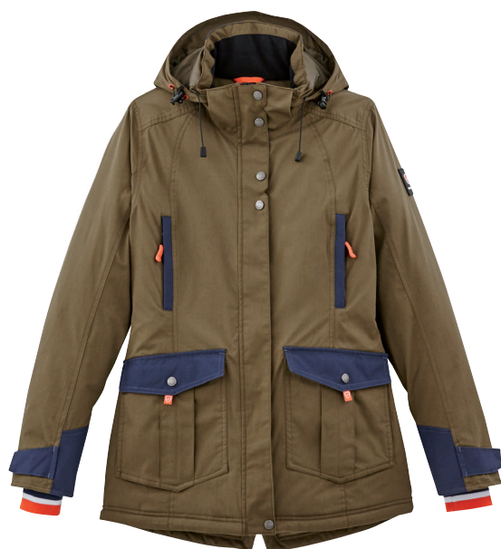
■ 1788 ARMY