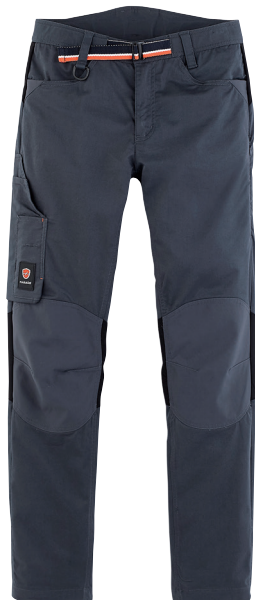
■ 1753 PARADE GREY

EN14404 + A1 (2010) Type 2 niveau 0 TAILLES 36-46