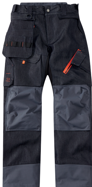
■ 1472 DENIM