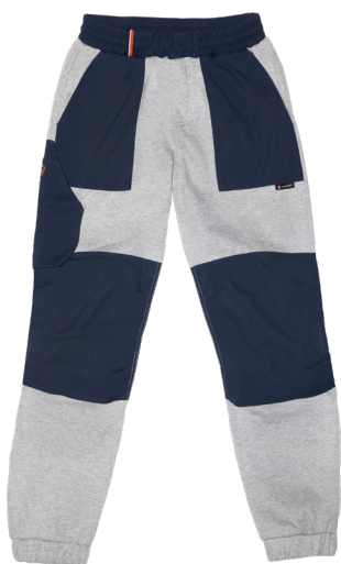
2492 PARADE BLUE/HEATHER GREY