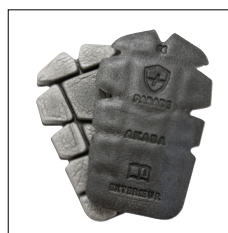
Genouillères Ankaro et Akaba normées CE EN 14404 vendues séparément