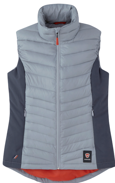
■ 1713 GREY