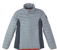
■ 1713 GREY