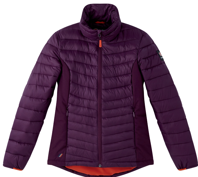
■ 1783 PURPLE