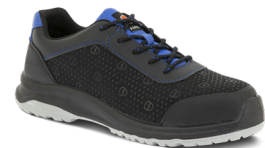
8832 BLEU | 35 ▶ 48

Maintien de la voûte plantaire Nouvelle version du DRS Semelle extra souple Bouclier anti-abrasion