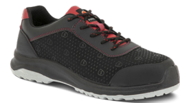
8836 ROUGE | 35 ▶ 48