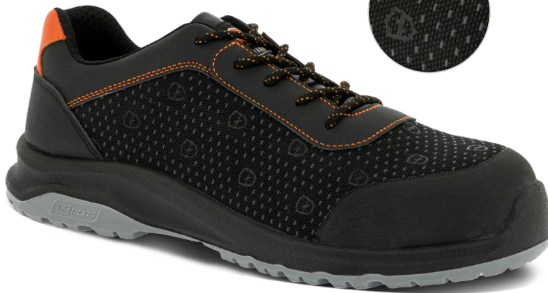
8834 NOIR | 35 ▶ 48