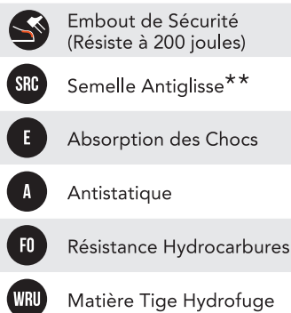
TABLEAU NIVEAU DE SÉCURITÉ