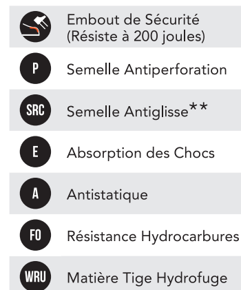
TABLEAU NIVEAU DE SÉCURITÉ