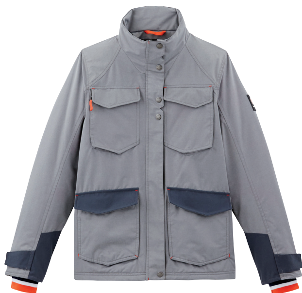
■ 1723 MID GREY